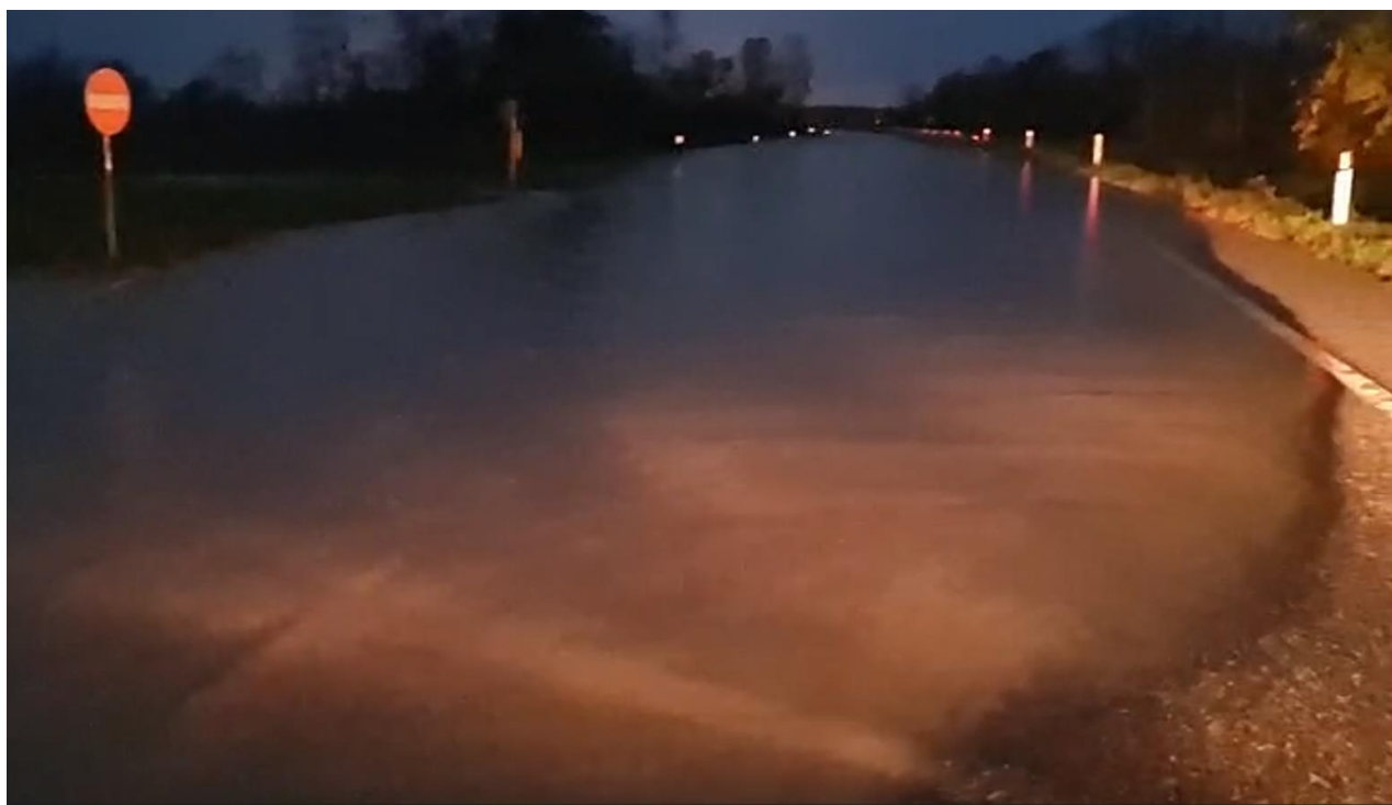
Foto 4: evidenza allagamento SR 305Var al km 0+500 nella notte tra il 16/11 e il 17/11