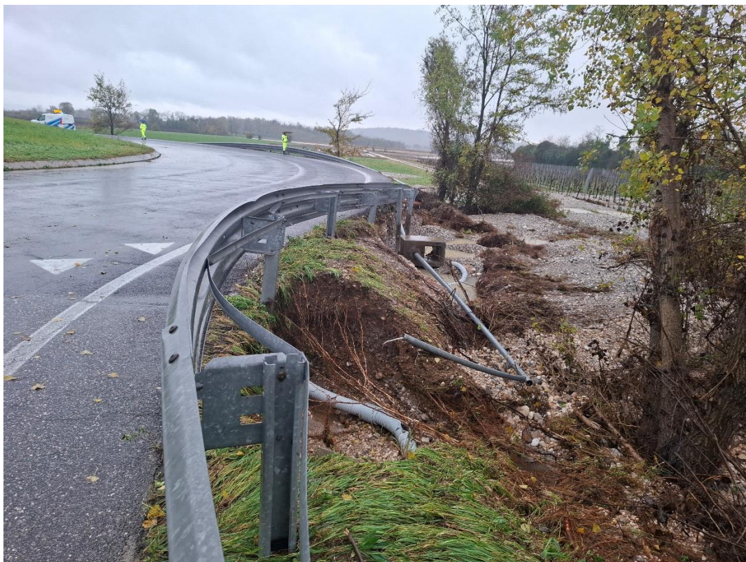
Foto 3: danneggiamento margine stradale destro della SR56 al km 20+860 e parte della rotatoria.