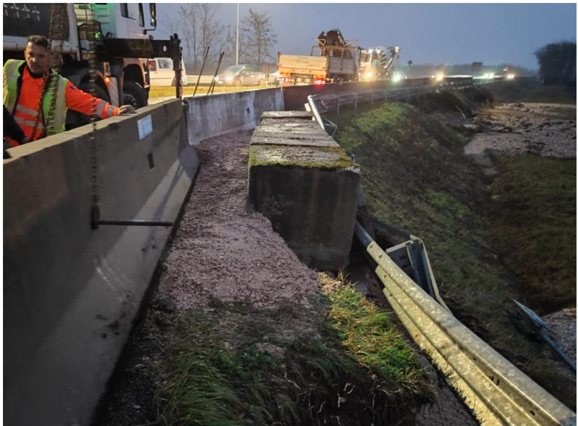
Figura 8: posa dei geo blocchi in cemento al km 0+000 della SR305 Var del 25/11/2025