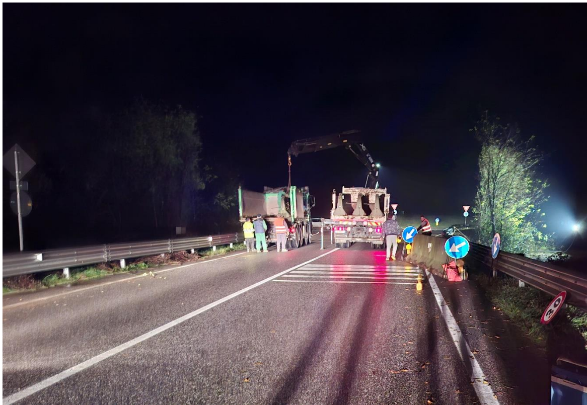
Figura 5: Operazioni di posa new jersey in cemento nella giornata del 17/11/2025 sera